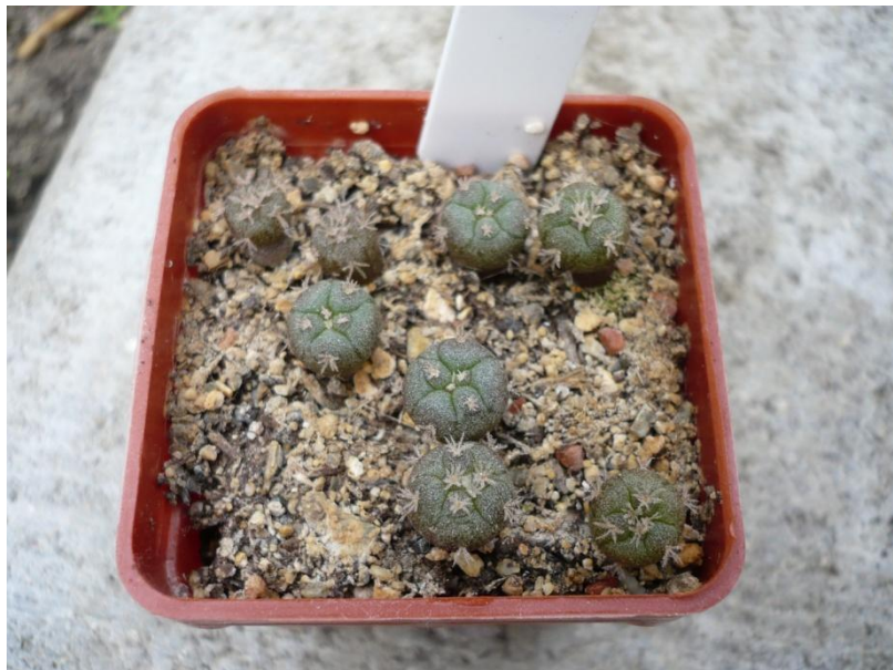
14 mesačné kaktusy (okrem tých napravo)